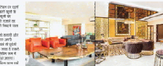
लिविंग रूम को सजावट के लिए आधुनिक पर्यायों की चीजें लयावते हैं।