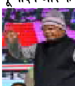
उन्होंने आरोप लगाया कि भाजपा के वरिष्ठ नेता सांपों के ज़हरीले सांप पर भरोसा करने का आग्रह करते हैं।

पटना (संवाददाता): बिहार के सियासी समर में मुकामला दिलबस होना दिखाई दे रहा है। एक ओर जहां बीजेपी के नेतृत्व वाला एनडीए गठबंधन है तो दूसरी ओर इंडिया गठबंधन है जिसमें राजद और कांग्रेस मू य रूप से शामिल हैं। एनडीए ने जहां बिहार में चुनाव का पूरी तरीके से फॉर्मूला निकाल लिया है तो वहीं इंडिया गठबंधन में टेशन अभी भी बरकरार है। एनडीए के लिए प्रधानमंत्री नरेंद्र मोदी ने जहां चुनावी अभियान की शुरुआत भी कर दी है जिसमें नीतीश कुमार भी शामिल रहे तो वहीं दूसरी ओर तेजस्वी यादव एक ऐसी सीट पर राजद उ मोदीवार के नामांकन पर पहुंचे थे जहां इंडिया गठबंधन के भीतर आपस में ही टकराव है। एनडीए गठबंधन जहां मजबूती से चुनाव लड़ना दिखाई दे रहा है तो वहीं इंडिया गठबंधन में कांग्रेस और राजद आपस में ही लड़ने हुए