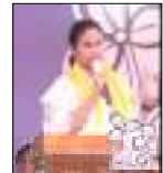
कूचबिहार में भाजपा के वरिष्ठ नेता सांपों के ज़हरीले सांप पर भरोसा करने का आग्रह करते हैं।

ममता बनर्जी ने कहा कि भाजपा के वरिष्ठ नेता सांपों के ज़हरीले सांप पर भरोसा करने का आग्रह करते हैं। उन्होंने आरोप लगाया कि भाजपा के वरिष्ठ नेता सांपों के ज़हरीले सांप पर भरोसा करने का आग्रह करते हैं। उन्होंने आरोप लगाया कि भाजपा के वरिष्ठ नेता सांपों के ज़हरीले सांप पर भरोसा करने का आग्रह करते हैं।