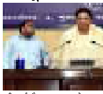
उत्तर प्रदेश की चुनावी रण में मायावती ने अकेले मैदान में उतरने का फैसला किया है।

लखनऊ (संवाददाता): उत्तर प्रदेश में सियासी बिसाल जबरदस्त तरीके से देखने को मिल रही है। कुछ समय पहले तक मायावती की बहुजन समाज पार्टी अपनी ताकत दिखाने की गुरुआत कर चुकी है। उत्तर प्रदेश की चुनावी रण में मायावती ने अकेले मैदान में उतरने का फैसला किया है।