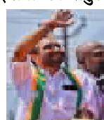
उन्होंने आरोप लगाया कि भाजपा के वरिष्ठ नेता सांपों के ज़हरीले सांप पर भरोसा करने का आग्रह करते हैं।