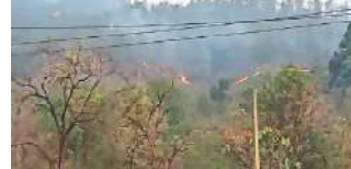
जमशोदपुर ०९/०५ है।

6 साल में 40 एकड़ जला दलमा, जड़ी रांची में क्यों हो रहा इतना पावर कट, बिजली विभाग ने बताई बड़ी वजह, अब डोर.टू.डोर होगा सर्वे